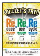
2024年度3R推進ポスター

アイキャッチな啓発ポスターを毎年製作して、オフィスや公共機関等において、3Rの推進を呼びかけています。